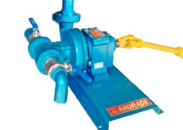
TAX - 51 MHE