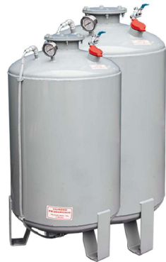
Reservatório Pressurizado Vertical Disponível para Água e Lubrificante, de 100/200L e 250/300L