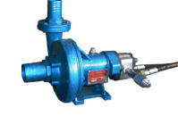
TAX - 51 MH