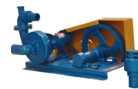
TAX - 51 com Polia e Correia