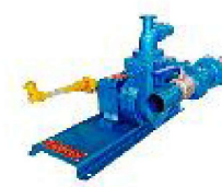
TASP - 51 MHE