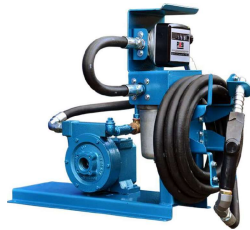
TAO - 38 MHE