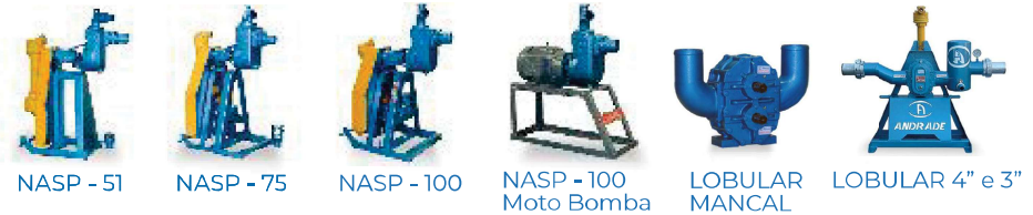
NASP - 51 NASP - 75 NASP - 100 NASP - 100 Moto Bomba LOBULAR MANCAL LOBULAR 4" e 3"