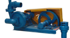
TAX - 75 com Polia e Correia