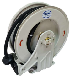
Carretél Retrátil Disponível para Ar, Graxa, Óleo, Água e Diesel