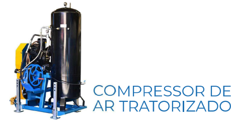
COMPRESSOR DE AR TRATORIZADO

25 a 50 Kva Cavalete, Polia grande (quatro canais C), Polia pequena (quatro canais C), cardã, mancal com eixo e rolamentos.