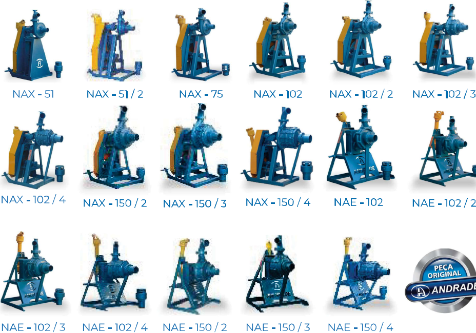
NAX - 51 NAX - 51 / 2 NAX - 75 NAX - 102 NAX - 102 / 2 NAX - 102 / 3