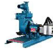
TASP - 51 MH