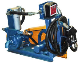
TAO - 38 com Polia e Correia

Bombas e equipamentos para abastecimento e auxílio, os suportes ideais para grandes equipamentos.