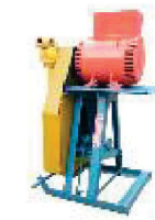
CAVALETE PARA GERADOR

3 a 7,5 Kva Cavalete, Polia grande (dois canais B), Polia pequena (dois canais B), cardã, mancal com eixo e rolamentos.