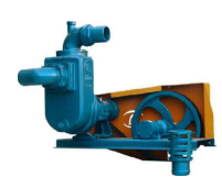
TASP - 75 com Polia e Correia