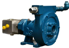
TAO - 38 MH