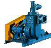
TASP - 51 com Polia e Correia